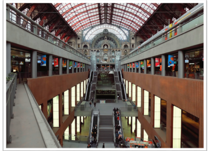
ILL. 5. Vue des quatre voies superposées

Au-delà des cas individuels, le colloque s'est focalisé autour de petites entreprises, de leur histoire, y compris celle de leur capacité de financement, éventuellement coopératif (Crédal) et appelle à une mise en relation dès le départ des objectifs de rentabilité et du souci d'assurer aux générations futures un avenir soutenable.