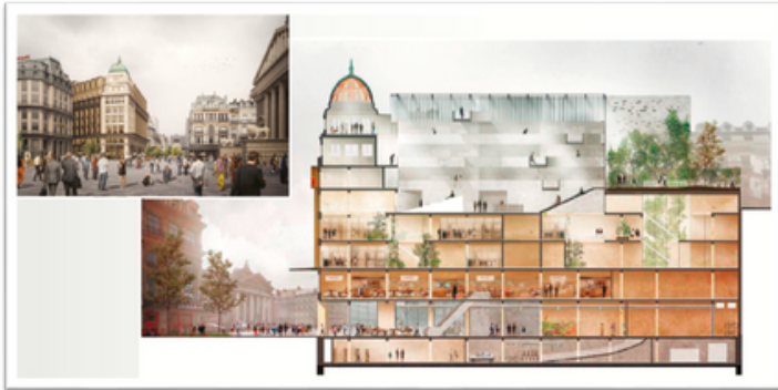
ILL. 3 vue du projet Dôme (Commerce, restauration et logements) © VDD Project Managment.

Centralisation des réseaux de fluides dans le pôle chimique du port d'Anvers-Bruges en remplacement des flottes de camions-citernes, illustrée par la mise en place de quelque 1.000 km de pipelines multi clients –