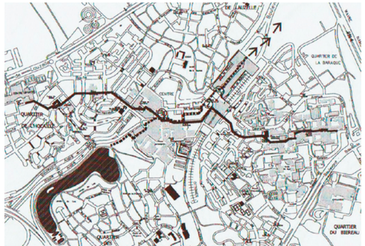
ILL. 2 Axe piéton principal et embranchements, indiqués en pointillé vers le lac et le centre commercial © Jean Remy.